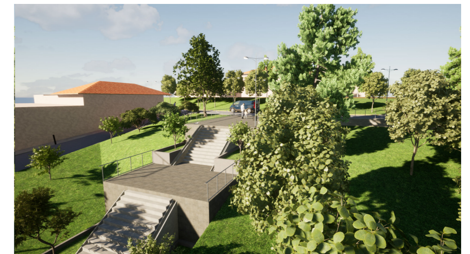
04 VISTA 03 PROPUESTA PASAJE 07